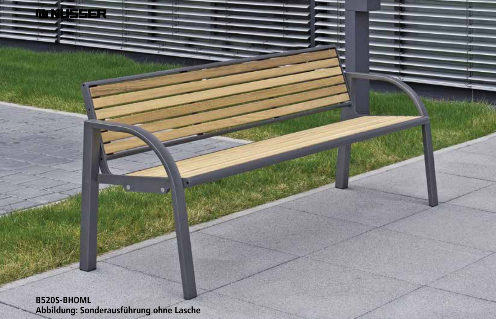
B520S-BHOML Abbildung: Sonderausführung ohne Lasche