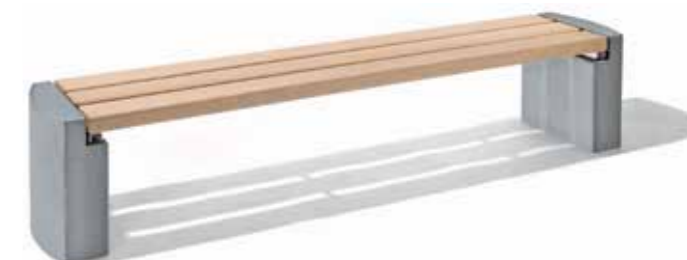
HALLE mit dunkelgrauem Betonfuß (Option)