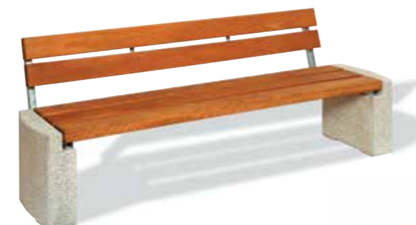
HALLE mit Granitfuß