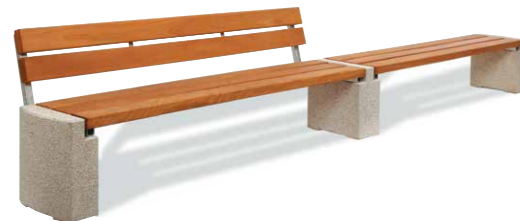
HALLE als Reihenbank